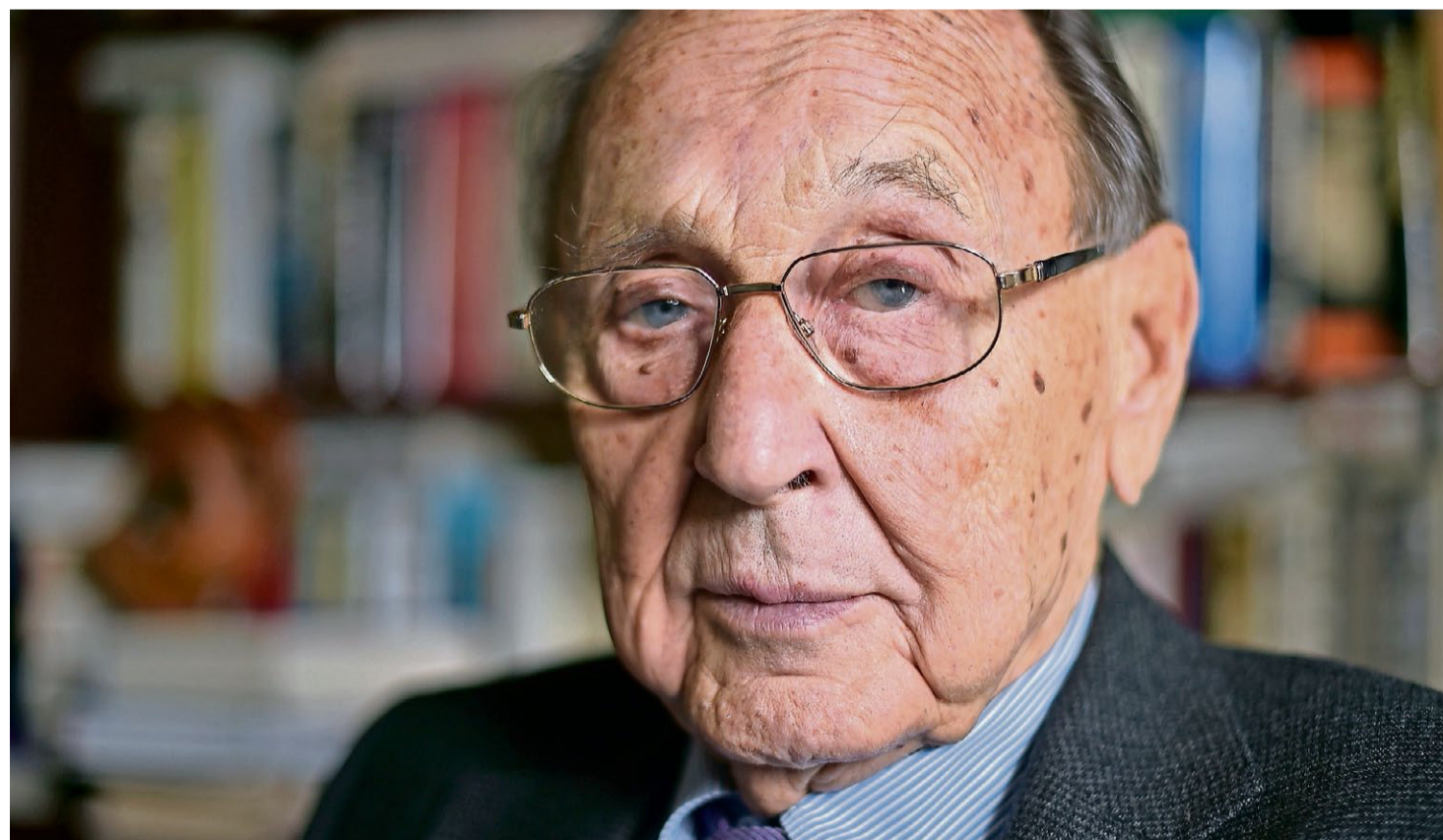
Im Kreis seiner Familie ist der frühere deutsche Aussenminister Hans-Dietrich Genscher zehn Tage nach seinem 89. Geburtstag gestorben.

Ex-Sowjetpräsident Michail Gorbatschow bezeichnete den Tod Genschers als einen persönlichen Verlust: «Man sagt, dass es in der Politik keine Freunde geben kann. Das stimmt nicht. Hans-Dietrich Genscher war in den letzten Jahren mein richtiger Freund. Ich habe einen Freund verloren.» red SEITE 23